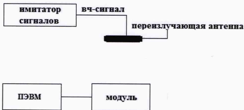
Рисунок 1 - Схема проведения измерений при опробовании, определении абсолютной инструментальной погрешности определения координат местоположения и скорости

8.2.1 Собрать схему в соответствии с рисунком 1.