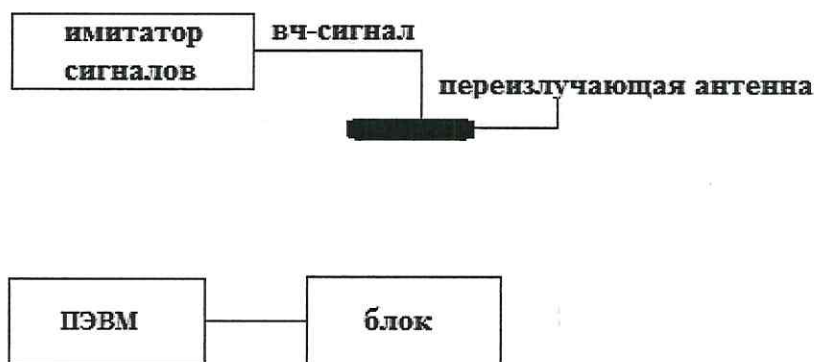
Рисунок 1 - Схема проведения измерений при опробовании, определении абсолютных инструментальных погрешностей определения координат местоположения и скорости

8.2.2 Исключить радиовидимость сигналов навигационных космических аппаратов ГЛОНАСС и GPS в верхней полусфере.